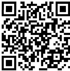
Vídeo de instalación