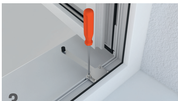
3 Apretar los tornillos parcialmente