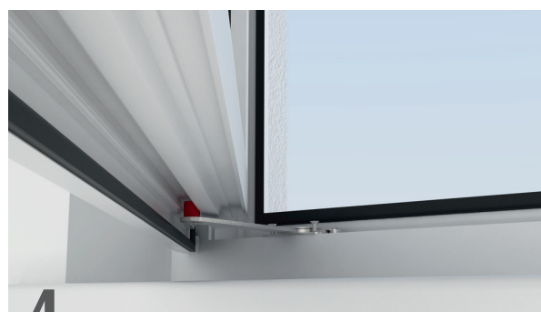
4 Inserte el brazo del freno magnético en la hoja, en la ranura del canal de 16 mm