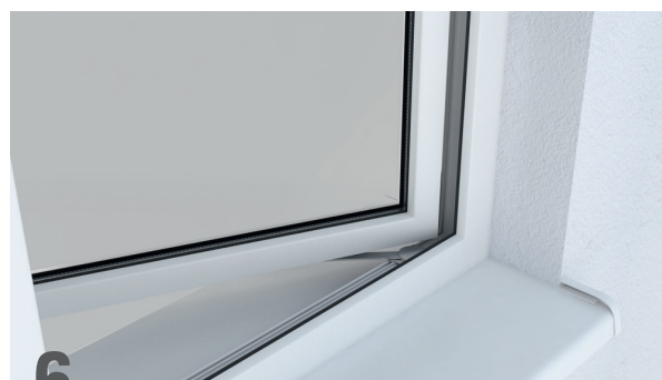
6 El freno magnético esta listo para usar