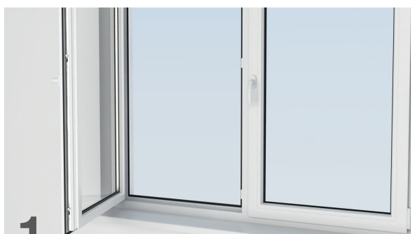
1 Abrir la hoja completamente (90° aproximadamente)