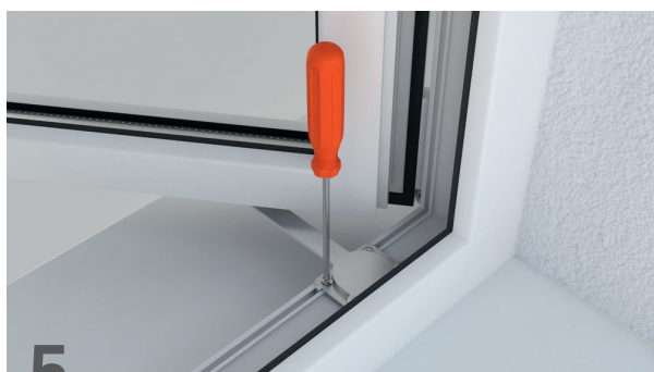
5 Apretar los tornillos